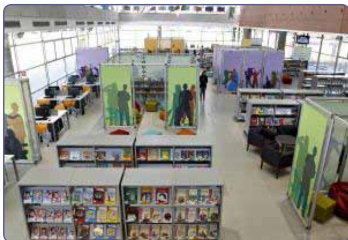
Biblioteca de São Paulo oferece tecnologia, recursos multimídia e ambientes exclusivos