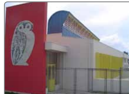
A coruja identifica as Escolas do Futuro que integram o SIBI-São Carlos

Conhecendo a Biblioteca (Projeto São Carlos de Todos Nós – Fundação Pró-Memória e Secretaria Municipal de Educação): Proporciona aos estudantes dos segundos anos da rede pública municipal um passeio cultural pela BPM Amadeu Amaral, permitindo uma viagem ao seu acervo especial, uma visita à Praça e ao Pé de Livro junto ao CRIASC, ao Espaço Braille e sua característica biblioteca, incentivando o jovem cidadão a frequentar esses espaços públicos.