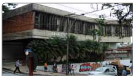
Na Biblioteca Pública Amadeu Amaral, a mais antiga da cidade, funciona o coração do SIBI

A Biblioteca Pública Municipal Amadeu Amaral, onde funciona o coração do SIBI, abriga um Infocentro, espaço que disponibiliza o uso de computadores e acesso gratuito à internet. As Escolas do Futuro, criadas desde 2002, são bibliotecas escolares comunitárias, instaladas ao lado das EMEBs – Escola Municipal de Educação Básica. Elas atendem tanto às EMEBs como a comunidade em seu entorno, desempenhando também o papel